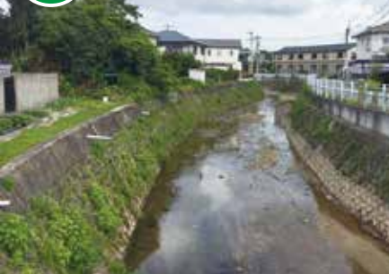
除草・浚渫が進む